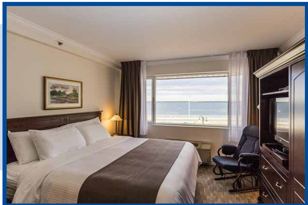
CHAMBRE STANDARD FLEUVE.